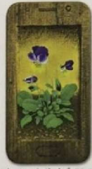
「ビオラ」スマホサイズ 72,360円

〈略歴〉1949年 熊本生まれ 1974年 東京造形大学卒業 1989年 カナダ国際ミニチュール展 セントラル美術館油絵大賞展 1990年 上野の森美術館油絵大賞展 伊藤廉記念賞展 1991年 セントラル美術館油絵大賞展 2004～18年 池袋東武にて個展 その他 東京銀座、表参道、吉祥寺、 大阪、熊本にて個展・グループ展多数 宝仙学園短期大学芸術学科で テンペラ技法を指導