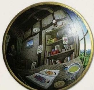
「トリー・ヘズステル号」φ16.2cm 170,640円

庭先に響くフィドルの不思議なメロディーが、 村人をホルガの岩山へと誘う。民家を舞台 に語られる、まことしやかな異国伝説のひと こまである。見知らぬ国のパノラマ旅行を 終え、凸面鏡の歪んだ部屋から蟹気楼の 街を眺める旅人…。タイムカプセルの物置 小屋で描く新作27点をご高覧くださいませ ようご案内申し上げます。